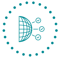
全球灵活性和全球能力