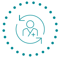
经验丰富的专业团队

QPS以首次人体(FIM)临床试验的超高成功率闻名。QPS所有I期试验中心均配备专业临床药理学团队, 每年例行完成数百项I/IIa期研究。我们亦在各种早期临床试验设计方面拥有专业科研能力, 包括剂量响应、单剂量爬坡试验 (SAD) 和多剂量爬坡试验 (MAD) 研究以及药物间相互作用研究。